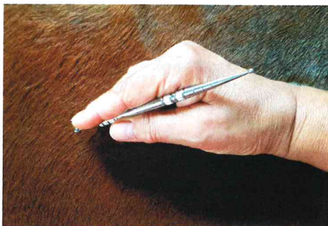
oben: Das Pferd genießt sichtlich die Akupunkt-Massage. rechts: Der APM-Stab für die Akupunkt-lassage am Pferd.

im Halfter gegangen als Fohlen (aus dieser Zeit gibt es unerkannte Verletzungen der Halswirbelsäule, die erst später, wenn die Pferde sich mehr versammeln sollen, zu Tage kommen). Einige vertreten sich im Spiel mit anderen Pferden. Dann gibt es die Pferde, die es irgendwie schaffen, sich ständig zu verletzen. Sie haben Narben am Kopf. Nach Operationen, bei denen die Pferde in Narkose gelegt werden, kann es immer wieder zu Unfällen kommen, wenn die Pferde erwachen, auch wenn man in den Kliniken sehr vorsichtig ist.