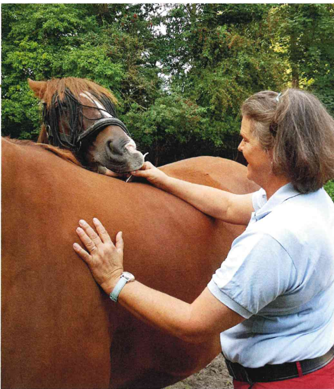
Die Behandlung mit dem APM Stab macht neugierig.